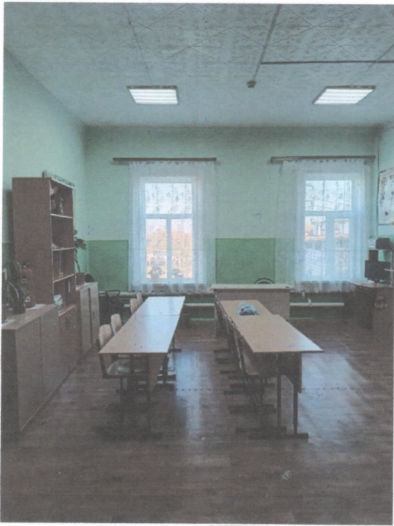
Рис.1 фото «До»